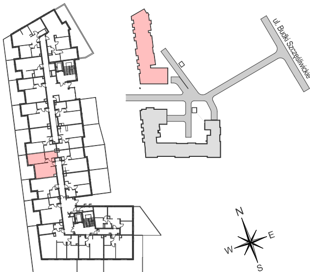
SCHEMAT LOKALIZACJI BUDYNKU

OBA SCHEMATY MAJĄ CHARAKTER JEDYNIJE POGLĄDOWY. W PRZYPADKU EWENTUALNYCH ROZBIEŻNOŚCI POMIĘDZY SCHEMATAMI, A PROJEKTEM BUDOWLANYM, WIĄŻĄCY JEST PROJEKT BUDOWLANY.