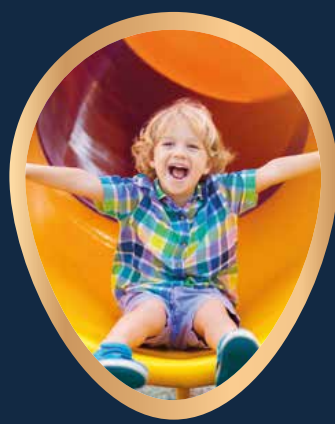
PLAC ZABAW DLA DZIECI