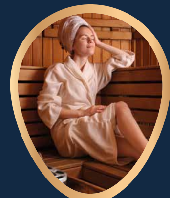
STREFA RELAKSU Z SAUNĄ