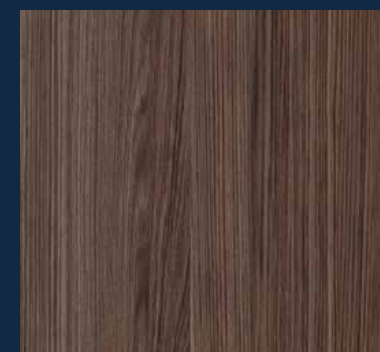
Fornir Orzech amerykański