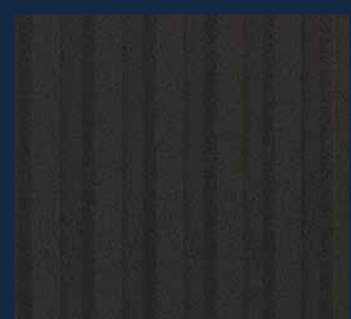
Lamele ścienne Antracyt