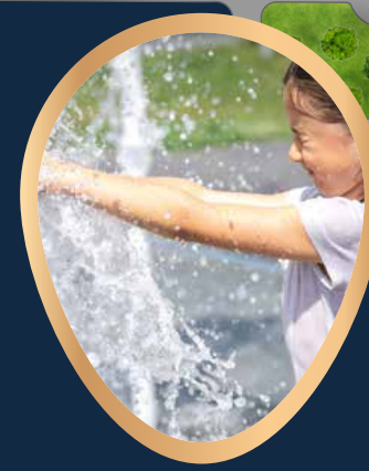
FONTANNA I ZRASZACZE