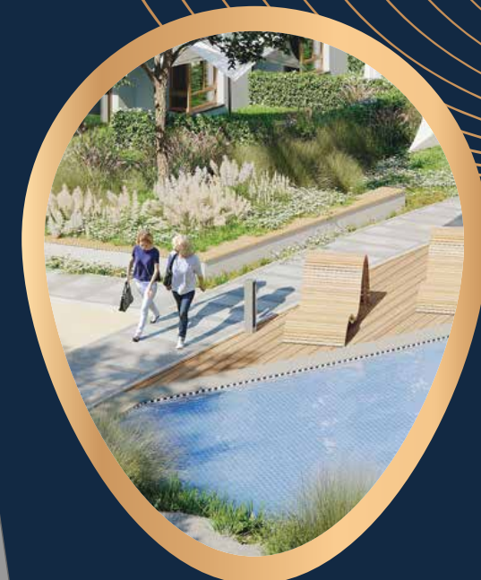
STREFY RELAKSU Z OCZKIEM WODNYM