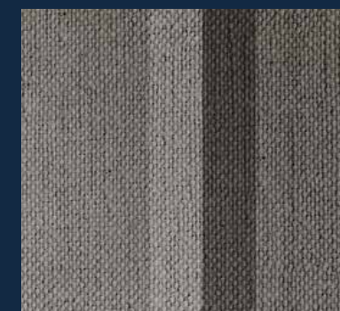
Tapeta Rohan Stripe