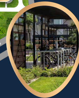
STOJAKI I STACJA ROWEROWA